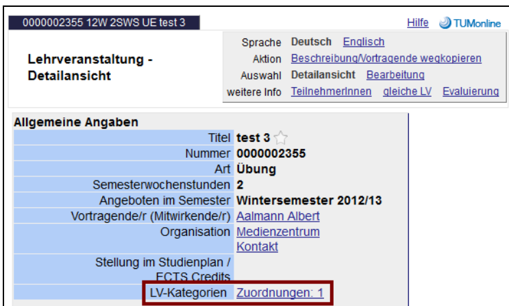
Abbildung 5: Die Kategorie in der LV-Detailansicht

Die einer Lehrveranstaltung zugeordneten Kategorien „eLearning“ findet sich in der LV-Erhebung in der Spalte „LV Kat.“ sowie auch in der LV Detailansicht unter „allgemeine Angaben“.