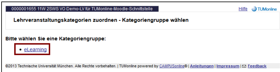
Abbildung 3: Auswahl der Kategoriengruppe „eLearning“

In der nachfolgenden Auswahlmaske wählen Sie die für Sie passende Option.